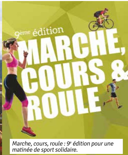
Marche, cours, roule : 9 e édition pour une matinée de sport solidaire.