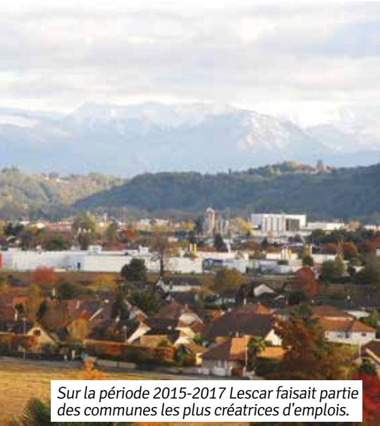
Sur la période 2015-2017 Lescar faisait partie des communes les plus créatrices d'emplois.